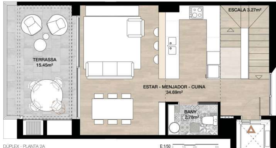
DÚPLEX - PLANTA 2A